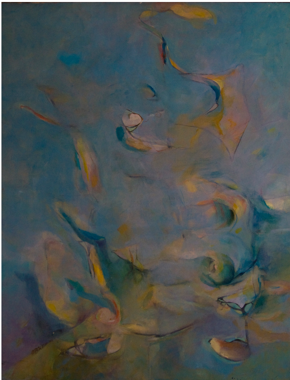
Zonder titel 1978